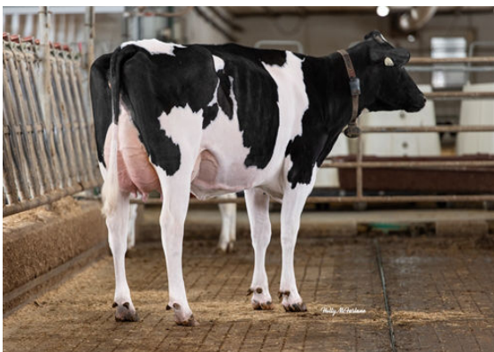
PROGENESIS CHALLENGER EMBRACE