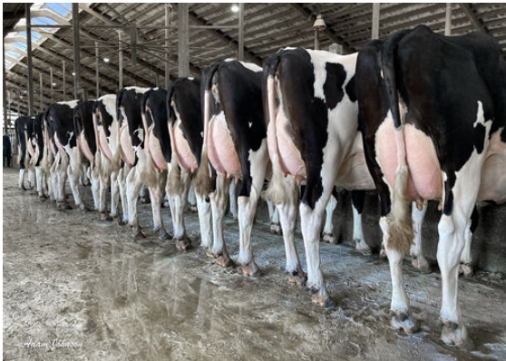
CHALLENGER DAUGHTER GROUP DAUGHTERS AT SANDY-VALLEY