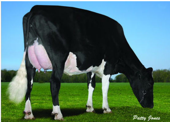
BARVEL LONGTIME ABBIE