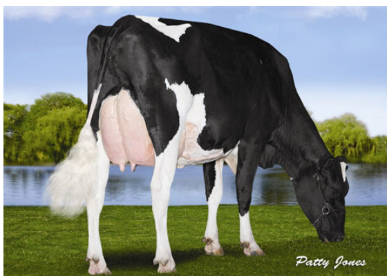
RANSOM RAIL FACEBOOK PARIS