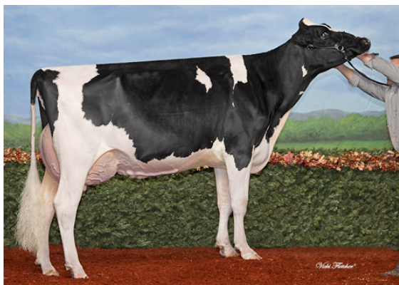
FIELDHOLME FACEBOOK FARRAH