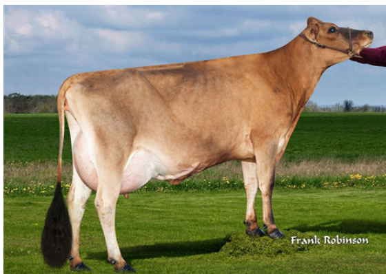
JX AHLEM SPIRAL ANORA 62476 {5} DAUGHTER

JX RIVER VALLEY CHIEF {6} RACHELLES VICEROY LOUISE VG-88%-6YR-USA CDF VICEROY RACHELLES GENOMINATOR 7857 AHLEM GENOMINATOR RACHELLES VITO 3353