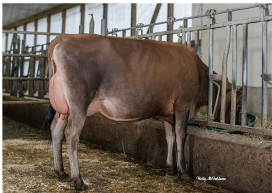
BRIDON BAR ENCHANT

JARS OF CLAY BARNABAS FDL PREMIER BELLE VG-87-3YR-CAN 1* HAWARDEN IMPULS PREMIER FDL CELEBRATING BELLE EX-90-2E-CAN 4* GALAXIES CELEBRITY LENCREST IATOLA FLEUR VG-85-4YR-CAN 3*