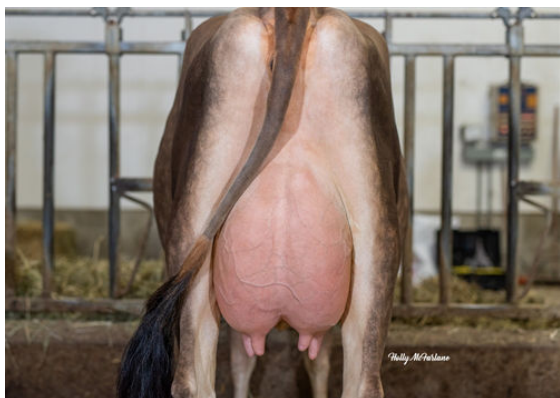
BRIDON BAR PEAR