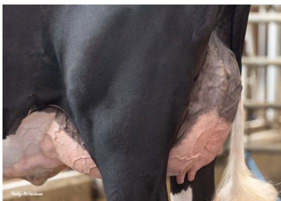
PROGENESIS CHAMPION PALAZZO