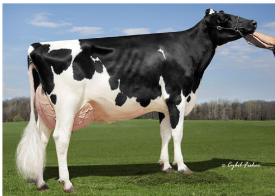
KINGS-RANSOM DELTA DESTINY