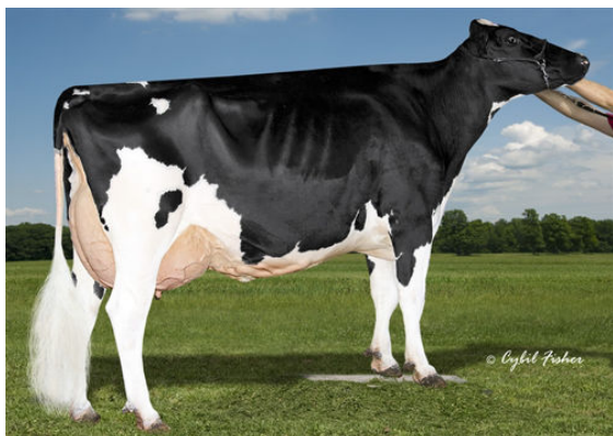
KINGS-RANSOM DM DEBONAIR