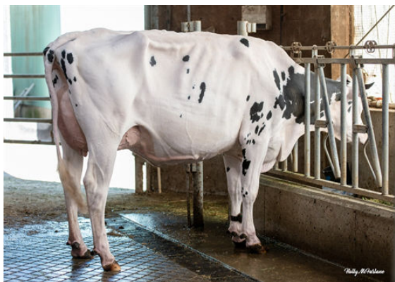
PROGENESIS BOMBA PARAGON GRANDDAM