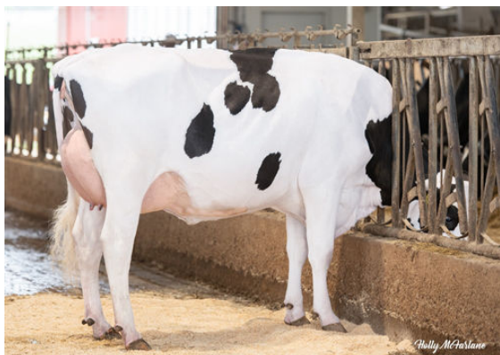
SANDY-VALLEY BORN2BOOGIE DAM