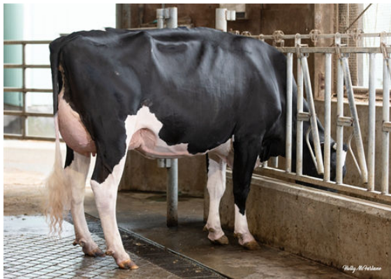
WESTCOAST PROVERB NAPPY 13158 DAM