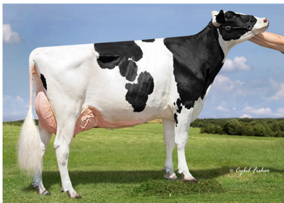
KINGS-RANSOM KROY CLIMAX GRANDDAM