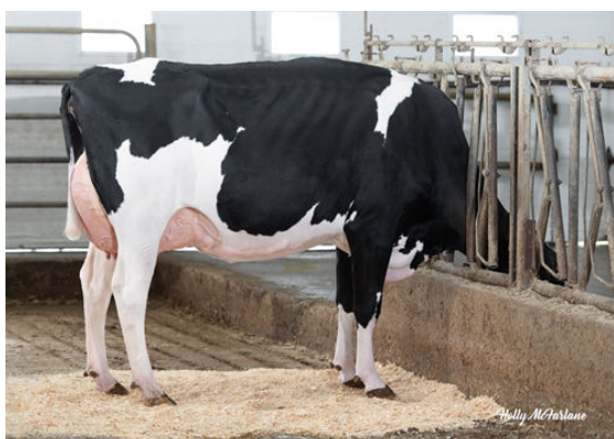
PROGENESIS ZAZZLE PAPRIKA