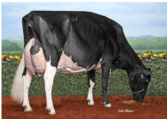
COMESTAR LAMADONA DOORMAN FOURTH DAM