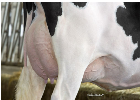
COMESTAR LATASHA TROPIC