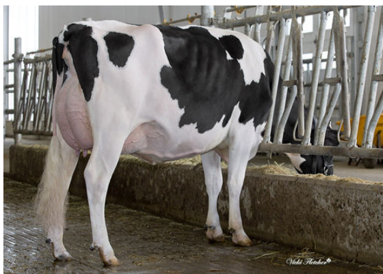
COMESTAR LATASHA TROPIC