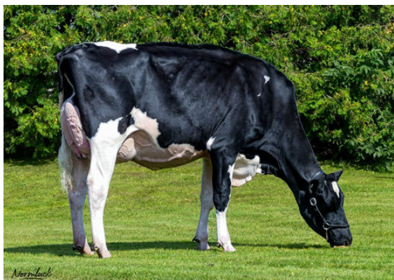
COMESTAR LATINET PERFECT