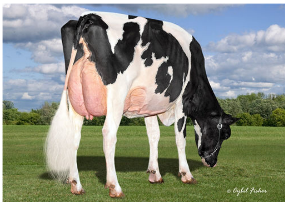
SIEMERS DOC HANAN 28286