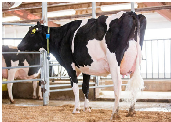
SIEMERS LSTR HANAN 33317