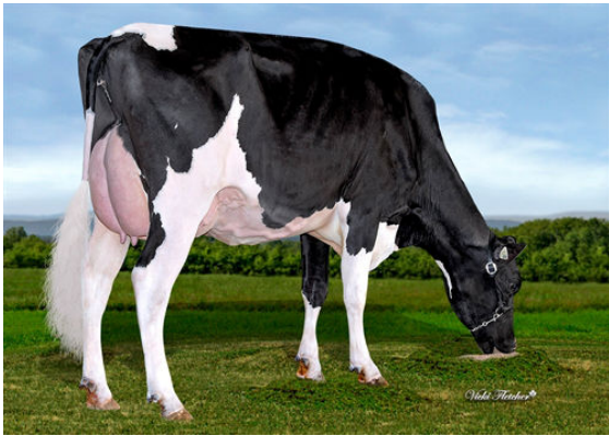
FEPRO PERFECT LINDOR