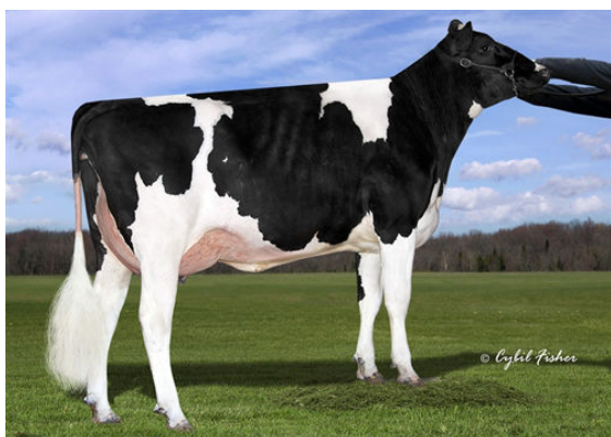
SIEMERS DENVER PARIS