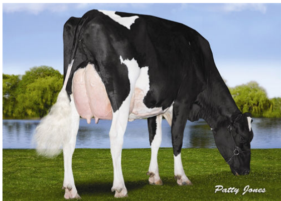
RANSOM-RAIL FACEBK PARIS