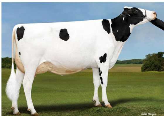
SANDY-VALLEY EVERYREASON GRANDDAM