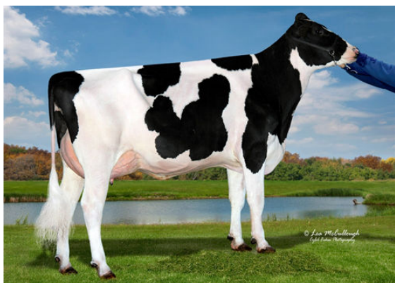
OCD DOORMAN 9689