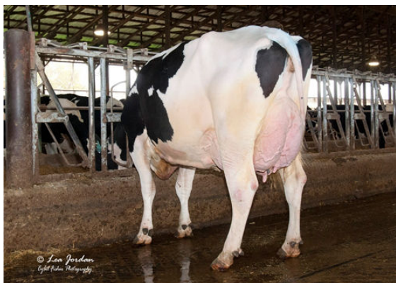
OCD DELTA 33343