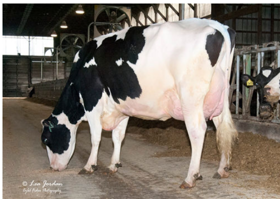
OCD DELTA 33343