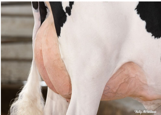
PROGENESIS ZAZZLE TWIGGY DAM