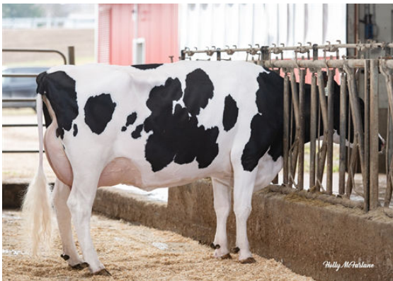
COOKIECUTTER A HOMILY