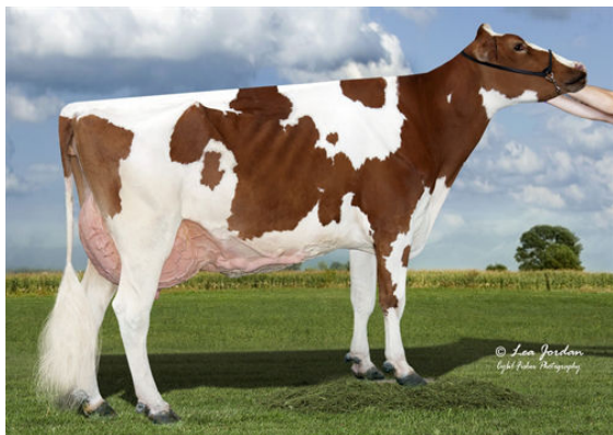
SCENERY-VIEW CELIA-RED FOURTH DAM