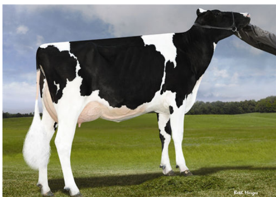
LADYS-MANOR S DAHLIA FIFTH DAM