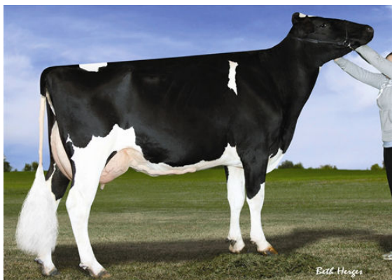
SCIENTIFIC DELUXE RAE-ETS