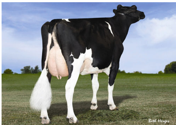
SCIENTIFIC DELUXE RAE-ETS