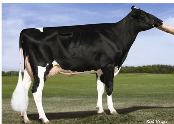
CO-VISTA ATWOOD DESIRE