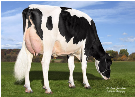
KINGS-RANSOM KD CARNIVAL DAM