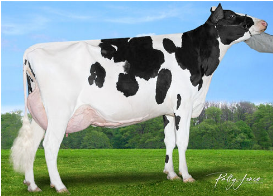
MORNINGVIEW DUKE ZIP