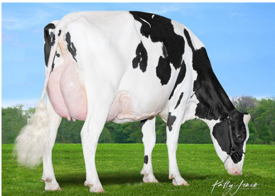
MORNINGVIEW DUKE ZIP