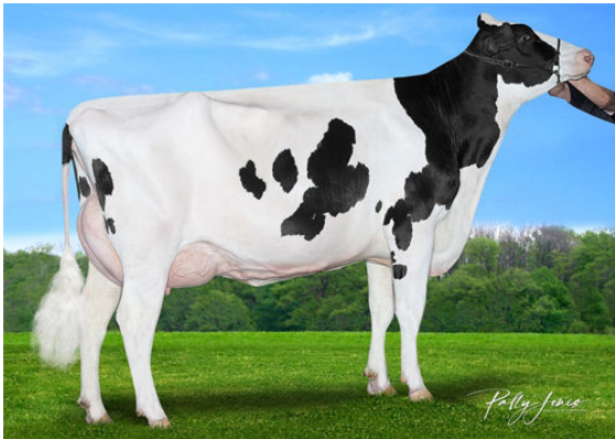
CLAYNOOK ZEETA PURSUIT