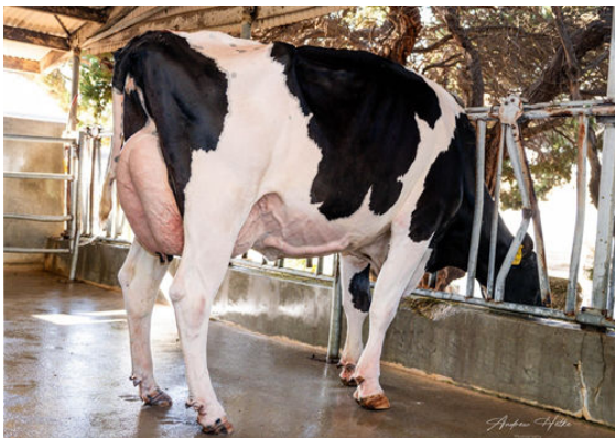
TERRA-LINDA DOC 794