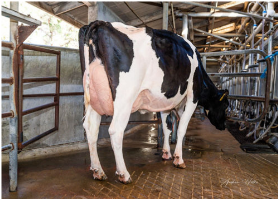
TERRA-LINDA DOC 794