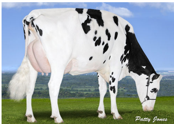
PEAK BOMBERO MAXIMA