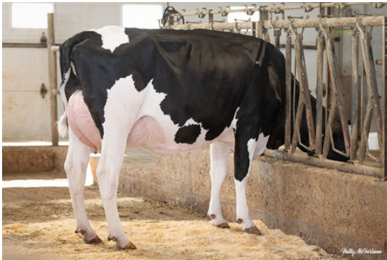
PROGENESIS GRAZIANO JAZMATIC DAUGHTER