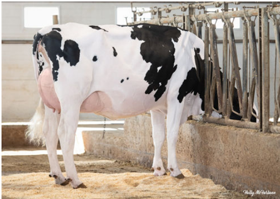
PROGENESIS GRAZIANO ELSA P DAUGHTER