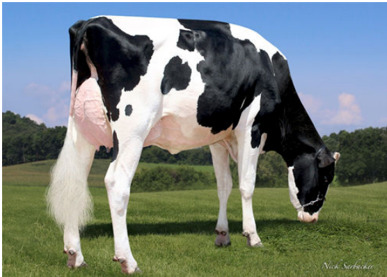
OUR-FAVORITE COMPELLING GRANDDAM