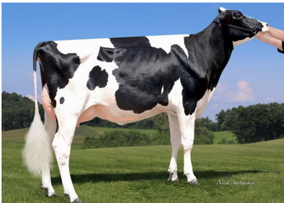
OUR-FAVORITE COMPELLING GRANDDAM