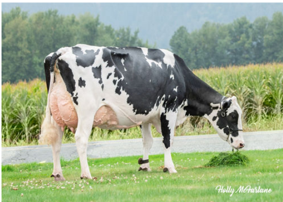
WESTCOAST ALCOVE RIZA 7512