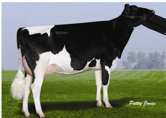
WHITTIER-FARMS HE REBECA