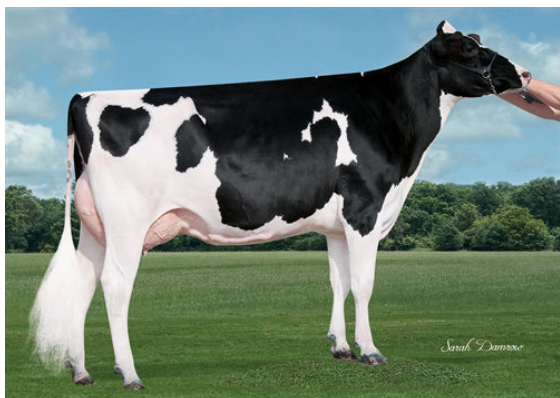
SIEMERS DOORMAN ROZ