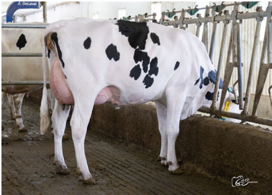
ANTIA ALLDAY BRITE DAUGHTER