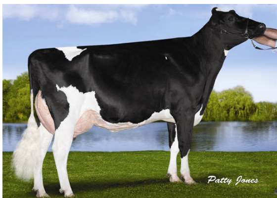
RANSOM-RAIL FACEBK PARIS