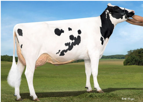
SANDY-VALLEY MOGUL AMBER THIRD DAM