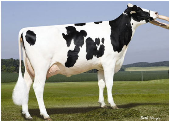
SANDY-VALLEY IO AMETHYST FOURTH DAM