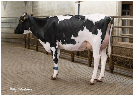
WESTCOAST MLIRE FAR8391 11926 DAUGHTER