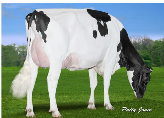
CLAYNOOK FABBY SILVER