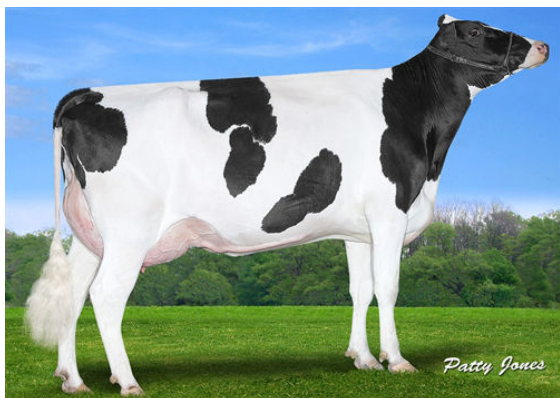
CLAYNOOK FIESTA MODESTY