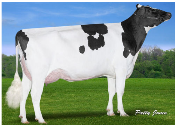
CLAYNOOK FABBY SILVER