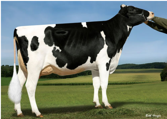
SANDY-VALLEY RBCN LOGAN DAM