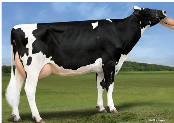
FAIRMONT DELTA RHONDA