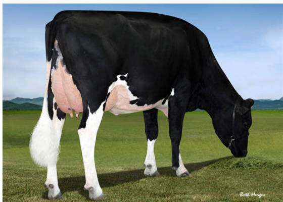
FAIRMONT TUFFENUFF RIDGE