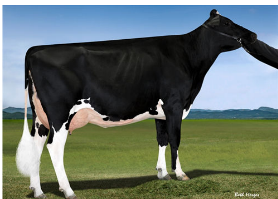
FAIRMONT TUFFENUFF RIDGE