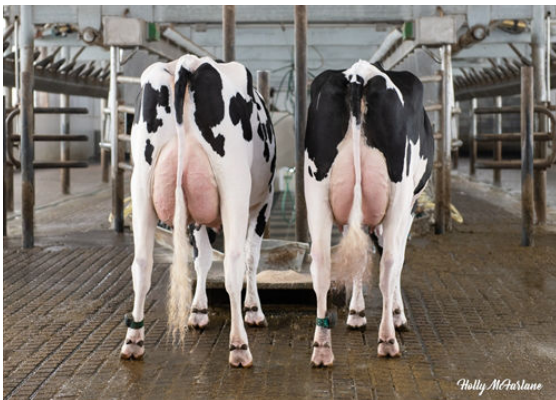
FASTBALL DAUGHTER GROUP L TO R - STANTONS FASTBALL WHO WON, STANTONS FASTBALL ALL MIGHTY