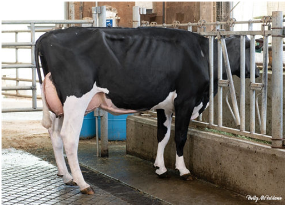
PROGENESIS FASTBALL PRISSY DAUGHTER