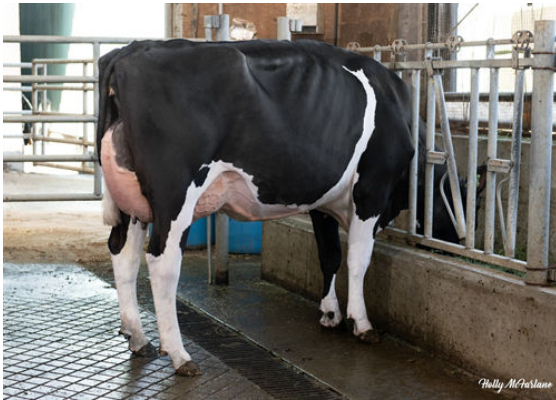
WESTCOAST FSTBL FAR8167 10707 DAUGHTER