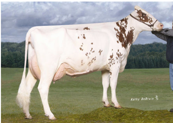
MD-VALLEYVUE CHRIS-RED FIFTH DAM