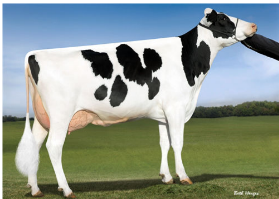
OCD SUPERSIRE 9882