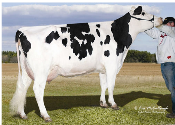
GLO-CREST O MAN PIRATE 4092