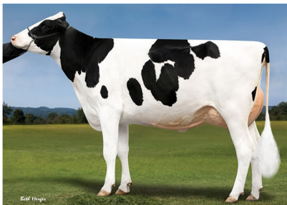
PROGENESIS DUKE MOLDAVITE