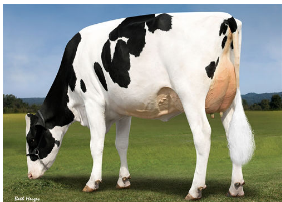
PROGENESIS DUKE MOLDAVITE