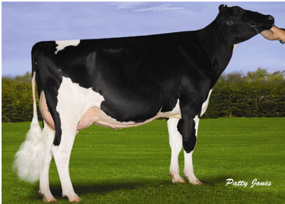
SANDY-VALLEY ATWD BRADY GRANDDAM