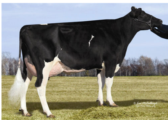
WELCOME MAC PEYTAN THIRD DAM