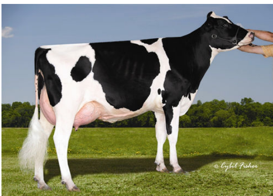
CHERRY CREST MANOMAN ROZ THIRD DAM