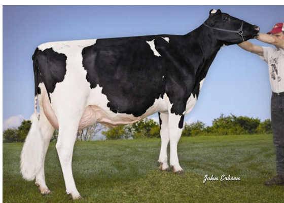
RALMA GOLDWYN CLARINET FIFTH DAM