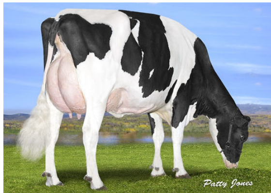
KANDY-KREEK MEGASIRE MONICA DAM